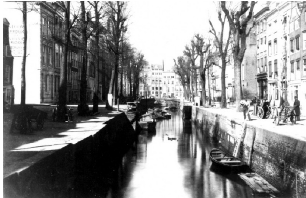
Bierhaven, richting Wijnhaven, omstreeks 1885 (huidige Jufferstraat). Oostelijk van de Bierhaven werd begin 17 e eeuw de Bierstraat aangelegd.