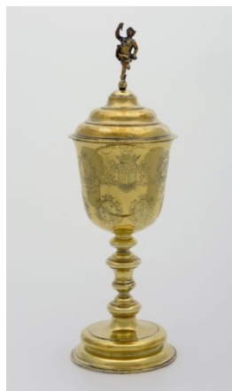
Verguld zilveren gildebeker uit 1721/1752

Naast zakelijke activiteiten vonden er in het Gildehuis roemruchte feestmaaltijden en toonaangevende evenementen plaats. Maar in 1828 viel het doek voor het Wijkopersgilde. Het Wijkopersgildehuis werd verbouwd tot pakhuis.